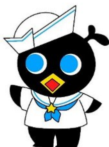
ひらつか市民活動センターキャラクター たすけくん

近年、市民のニーズが多様化・複雑化する中で、多くの市民活動団体や地域団体、事業者、教育機関などが地域課題解決の担い手として活躍しています。