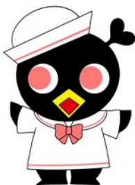
ひらつか市民活動センターキャラクター あいちゃん

市民活動団体や地域団体、事業者、教育機関等の、本市のまちづくりの担い手を育成するとともに、相互の交流及び連携を図り、多様な主体による協働のまちづくりを推進するために必要な長期的・安定的財源を確保するため、平成30年9月に創設しました。