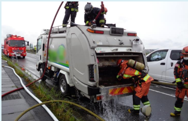
消火活動の様子（令和4年5月）