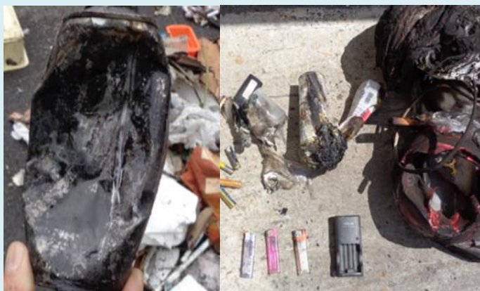
火災の原因とみられる内容物

近年、中身が入ったスプレー缶、カセットボンベ、使い捨てライターやリチウムイオン電池をはじめとした充電式電池が原因とみられるごみ収集車などの火災が多発しています。不燃ごみ収集車では、令和2年度に5件、令和3年度に3件、令和4年度に6件の火災が発生しました（令和5年11月現在）。