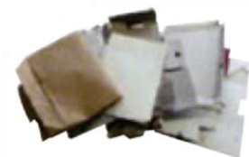
その他の紙（名刺以上の大きさ）

資源再生物は、いずれも貴重な資源としてリサイクルされます。皆様におかれましては、改めて適正な分別・排出について、ご協力をお願いします。