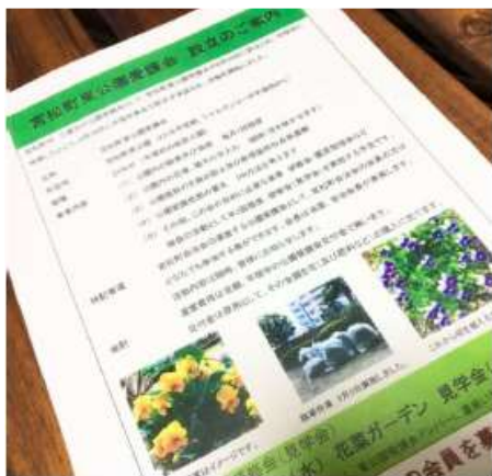
公園愛護会設立案内ちらし