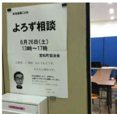
自治会長による よろず相談 (自治会館)