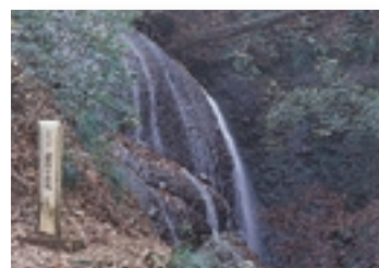
霧降りの滝・松岩寺